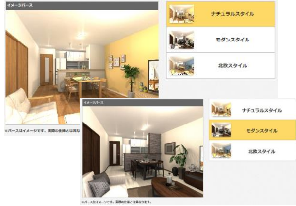
<内装イメージパース>