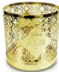
キャンドルポット /ペンたて