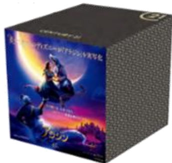
ボックスティッシュ